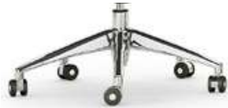
Base en aluminio pulido Base en alumini polít / Base en aluminium poli / Polished aluminium base / Fußkreuz Aluminium poliert.