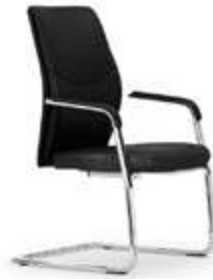
Balancín. Confident / Luge / Cantilever / Freischwinger.