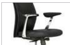
Brazos con apliques tapizados. Braços amb detall entapissat / Accoudoirs avec manchettes tapissées / Upholstered armrest / Gepolsterte Armauflage