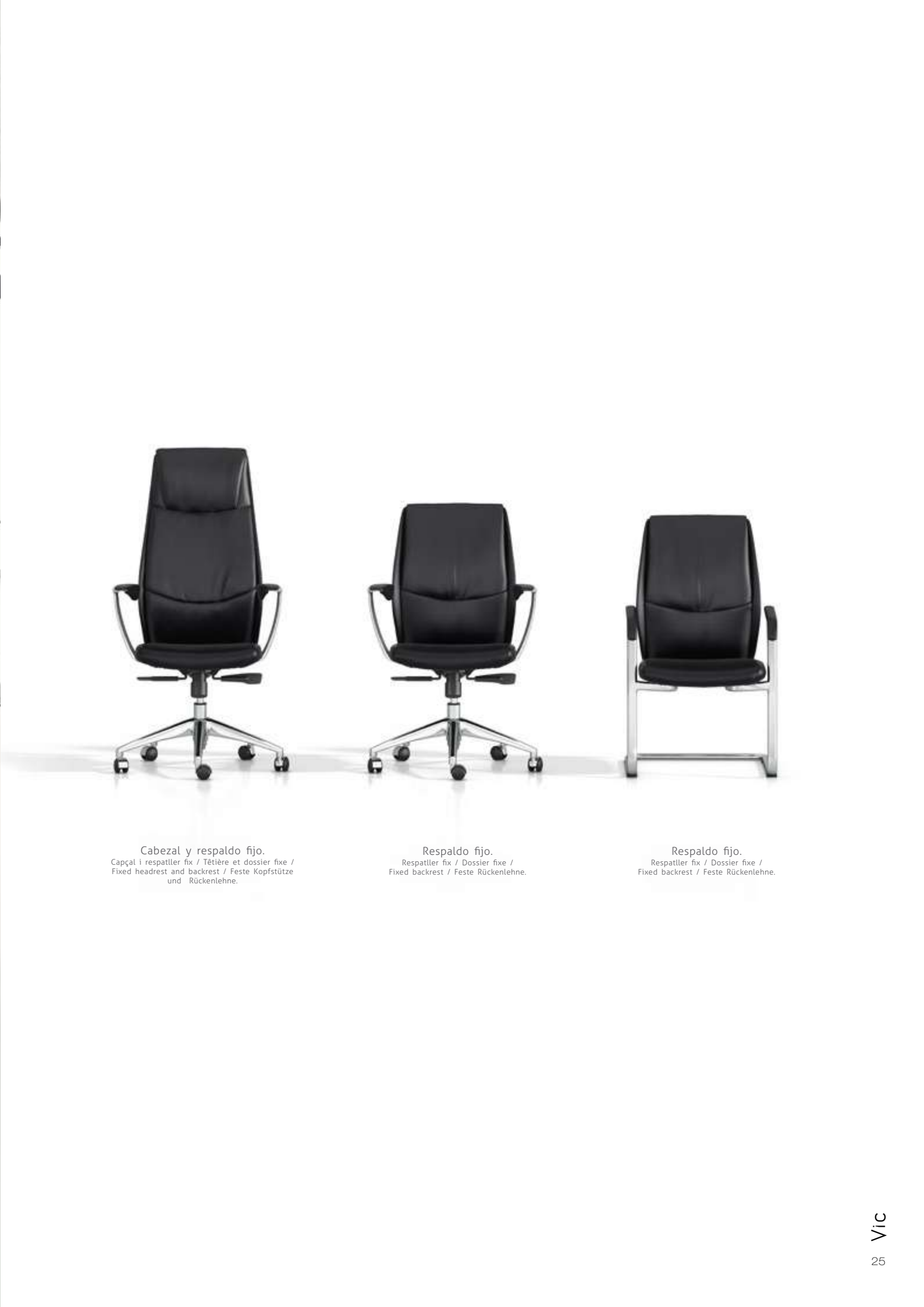
Cabezal y respaldo fijo. Capçal i respallier fix / Tête et dossier fixe / Fixed headrest and backrest / Feste Kopfstütze und Rückenlehne.