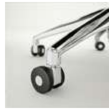
Ruedas dobles Ø 50 mm Rodes dobles Ø 50 mm / Roulettes doubles Ø 50 mm / Double wheels Ø 50 mm / Doppellaufrollen Ø 50 mm.