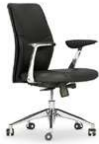
Respaldo medio. Respatller mitjà / Dossier moyen / Medium backrest / Mittlere Rückenlehne.