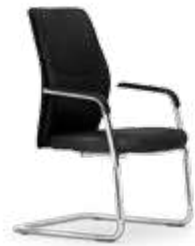
Estructura cromada. Estructura cromada / Structure chromée / Chrome frame / Gestell Verchromtes.