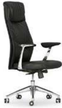
Silla de dirección. Cadira de direcció / Siège de direction / Executive chair / Chefessel.