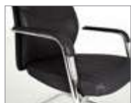
Brazos con apliques tapizados. Braços amb detall entapissat / Accoudoirs avec manchettes tapissées / Upholstered armrest / Gepolsterte Armauflage